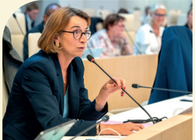
Pour Vincennes, c'est une chance d'avoir un Maire qui siège au Conseil régional d'Île-de-France, comme Charlotte Libert. En lui faisant confiance le 15 mars, les Vincennois font le choix de conserver un Maire capable de peser pour Vincennes à la Région, au cœur d'une collectivité qui décide de politiques structurantes pour notre quotidien : transports, lycées, formations sanitaires et sociales, développement économique, etc.

ainsi qu'une meilleure information sur les dispositifs existants, plutôt que la création de nouvelles structures (par exemple : mieux informer les Vincennois sur la mutuelle régionale plutôt que de créer une mutuelle communale) ;